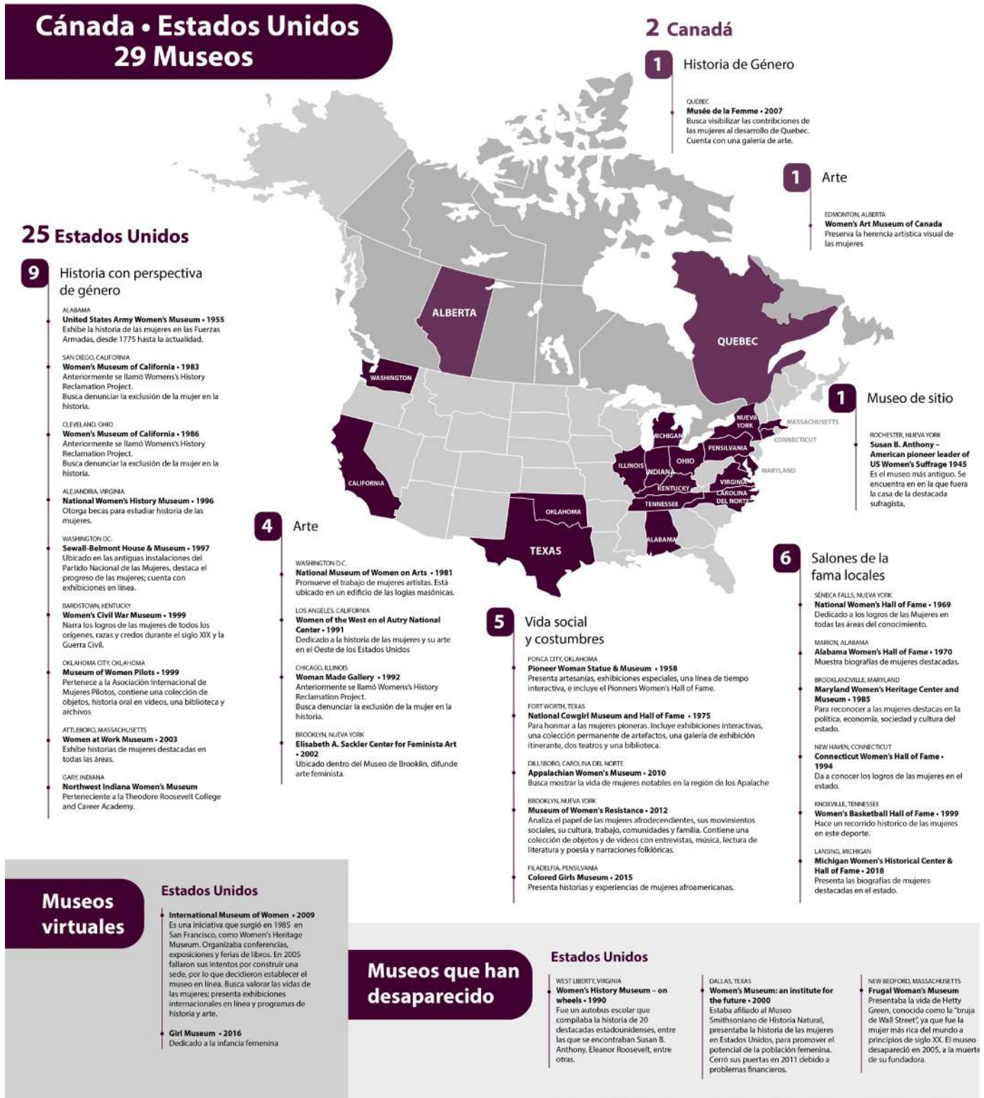
Figura 5. Museos de la Mujer en Estados Unidos y Canadá. Patricia Galeana, 2020

En América hay 29 museos: 25 en Estados Unidos. De ellos, nueve son de historia de género, cinco presentan la vida social y costumbres de las mujeres, seis son salones de la fama con las semblanzas a las mujeres más destacadas a nivel local, cuatro son de arte y uno es un museo de sitio. Además, existen dos museos virtuales y tres han desaparecido. Canadá, por su parte, tiene dos museos sobre este tema: uno de arte y otro de historia. Por su parte, en América Latina hay cuatro museos: dos en las capitales de Argentina y de México y dos locales, uno en Córdoba, Argentina y otro en Barrancabermeja, Santander, Colombia. Existen también cinco museos virtuales y un proyecto en Bogotá, Colombia; dos museos virtuales desaparecieron en Haití y Chile.