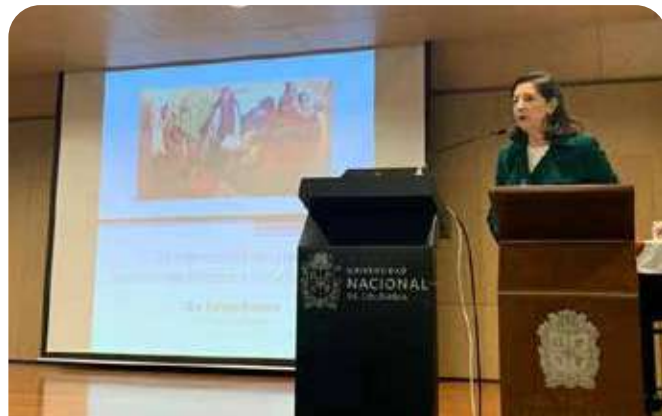
Conferencia del Día Internacional de la Mujer

En el marco del día internacional de la Mujer, la Titular participó en el ciclo “ El Papel de la Mujer en el Contexto Actual ” que llevó a cabo la Universidad Nacional de Colombia.