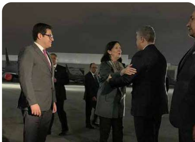
Presidente Duque en México